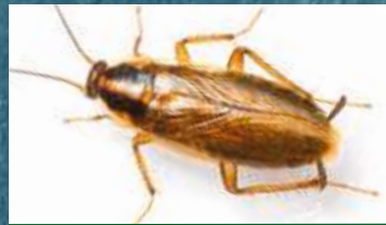
BLATTE GERMANIQUE Blattella Germanica