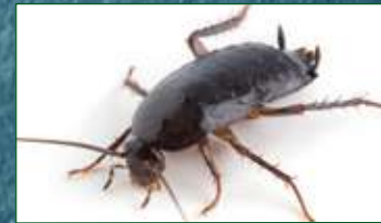
BLATTE ORIENTALE Blatta Orientalis