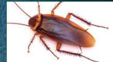
BLATTE AMÉRICAINNE Periplaneta Americana