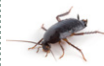
■ BLATTE ORIENTALE ■