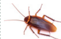
■ BLATTE AMERICAINE ■