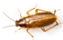
■ BLATTE GERMANIQUE ■