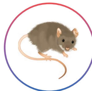
Souris Mus musculus (adultes et juvéniles)