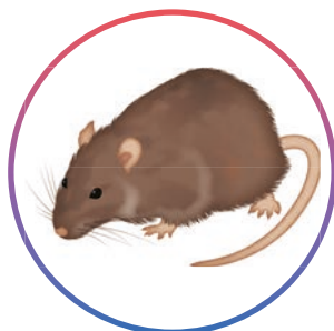
Rat brun Rattus norvegicus (adultes et juvéniles)