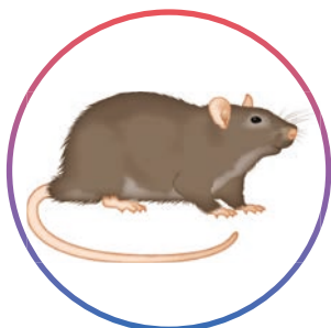
Rat noir Rattus rattus (adultes et juvéniles)